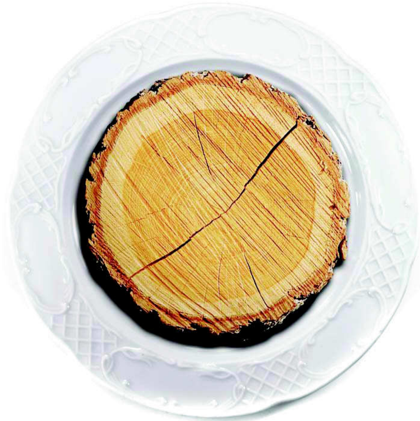
แวล์ชวนเซิมของจอมปลวก